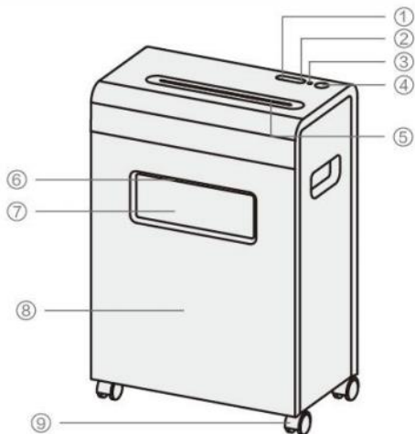
图示仅供参考 具体以实际为准（不同货号形状不同）