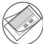
当护卡膜大小 不合适时(图A)

(2) 建议使用比塑封物大5~6mm的护卡膜。过大或过小都会影响塑封效果。如无大小合适的护卡膜, 也可使用较大的护卡膜。按照下图 (A) 图示使用, 夹入其它纸张, 待塑封后再将其裁去。