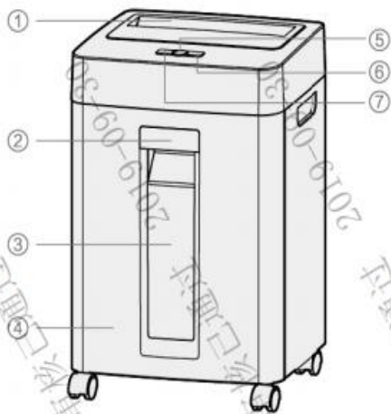
图示仅供参考 具体以实际为准（不同货号形状不同）